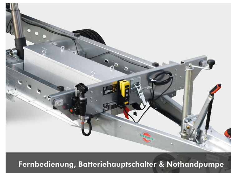
Fernbedienung, Batterie Hauptschalter & Nothandpumpe