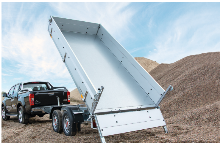
wasserfester Holzboden mit zusätzlich verzinkter Stahlblechauflage

Die Kippbrücke wird mit einer zusätzlichen Schließesicherung einfach arretiert. Der im Fahrgestell integrierte Schienenhalter (optional) mit abschließbarem Fach sorgt die ganze Fahrt über für einen sicheren und ruhigen Transport. Die passenden ALU-Auffahrampen sind über die gesamte Ladebreite individuell verschiebbar und als Zubehör erhältlich.