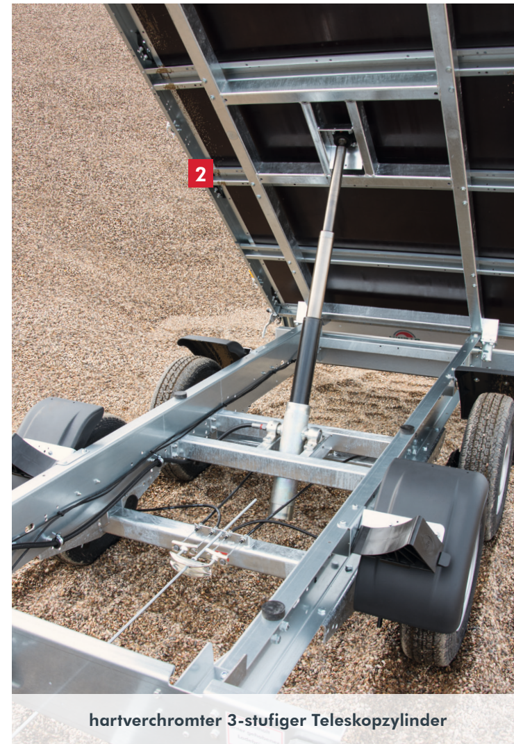
hartverchromter 3-stufiger Teleskopzylinder

Bilder sind Musterabbildungen und können Sonderausstattung enthalten.