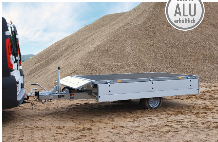
allseitig abklapp- und abnehmbare Bordwände