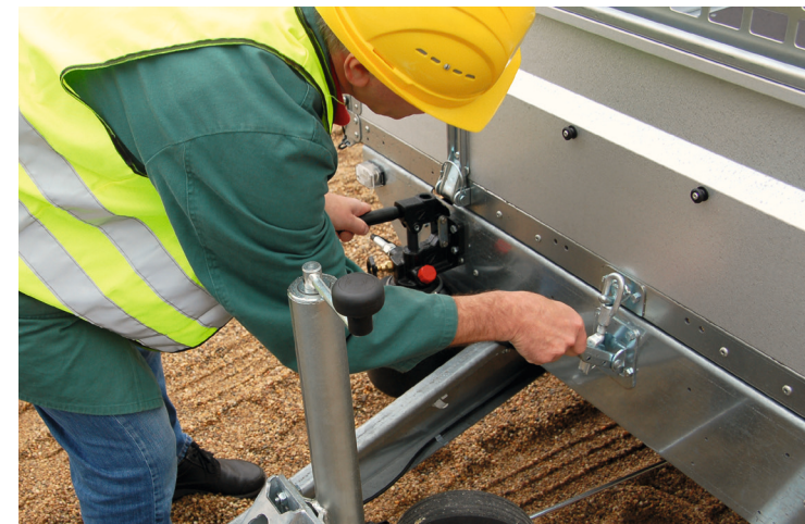
Schließesicherung für Kippbrücke