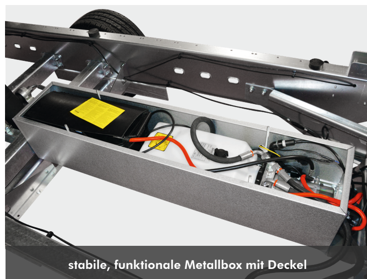
stabile, funktionale Metallbox mit Deckel