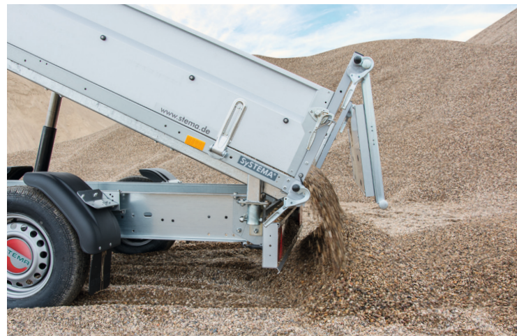
Rückwand als Klapp- oder Pendelbordwand