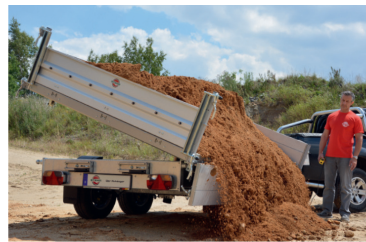
allseitig abklapp- und abnehmbare Bordwände