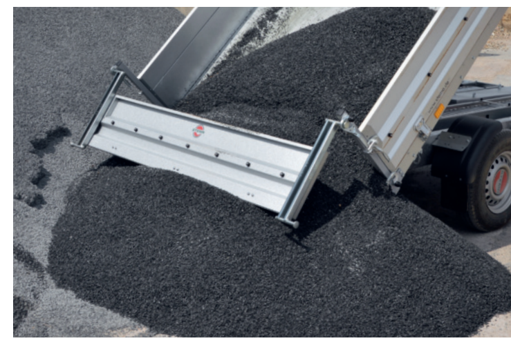
Rückwand als Pendelbordwand