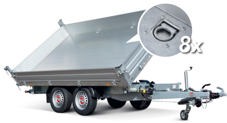
verzinkter Stahlblechboden mit versenkten Schwerlast-Zurringen

Bilder sind Musterabbildungen und können Sonderausstattung enthalten.