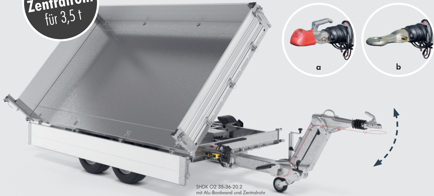
SHDK O2 35-36-20.2 mit Alu-Bordwand und Zentralrohr