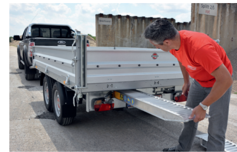
abschließbares Einschubfach für Auffahrampen (optional)