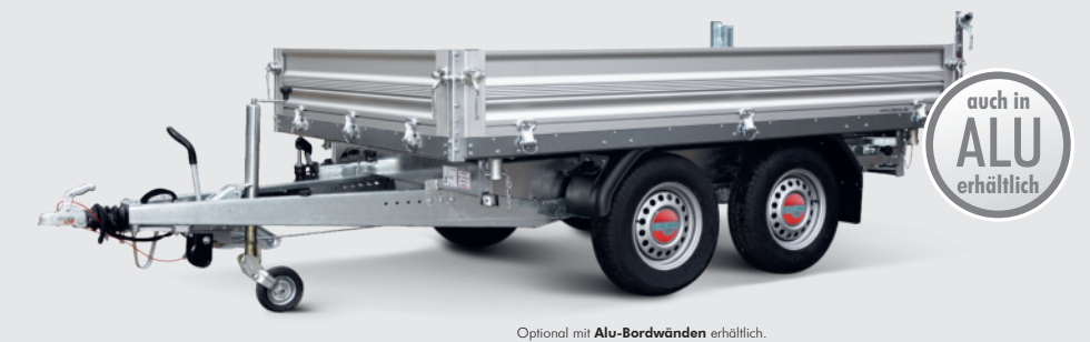
Optional mit Alu-Bordwänden erhältlich.